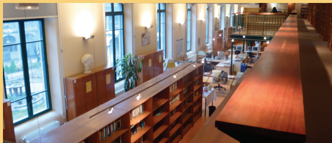
Un CDI au fonds documentaire riche en presse, revues et ouvrages de référence.